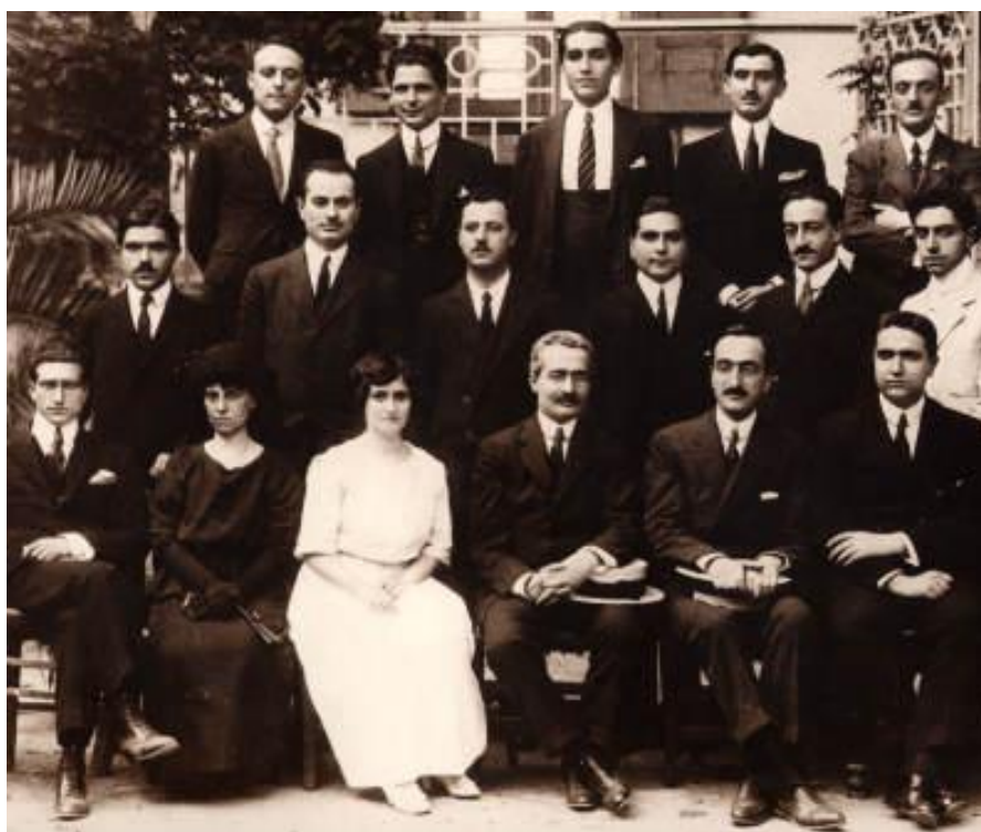
Moscati con un gruppo dei suoi allievi