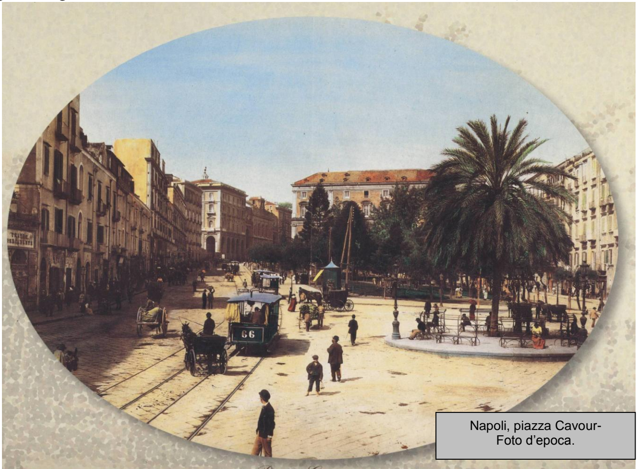
Napoli, piazza Cavour- Foto d'epoca.

In un'altra occasione, quando per decreto del Ministero della pubblica istruzione si vietò l'insegnamento negli ospedali presso i letti dei malati agli universitari che si preparavano ad essere medici, Moscati intraprese una vera e propria battaglia contro il decreto ministeriale, scrivendo a Benedetto Croce. Gli ospedali napoletani fino ad allora erano stati la palestra dell'insegnamento libero e là si erano formati la quasi totalità dei medici del Mezzogiorno, tra cui illustri clinici, come Domenico Cotugno e Antonio